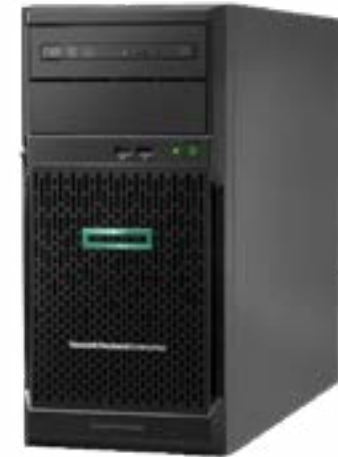
ProLiant ML30 Gen10