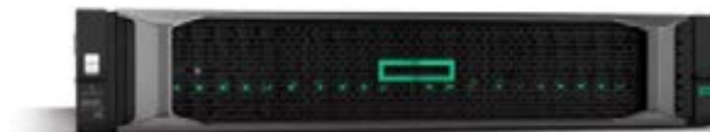
ProLiant DL385 Gen10