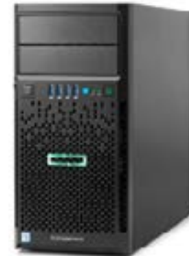
ProLiant ML30 Gen9