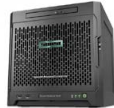
ProLiant Microserver Gen10