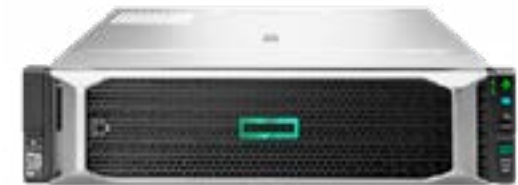
ProLiant DL180 Gen10