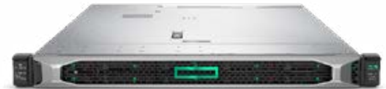
ProLiant DL325 Gen10