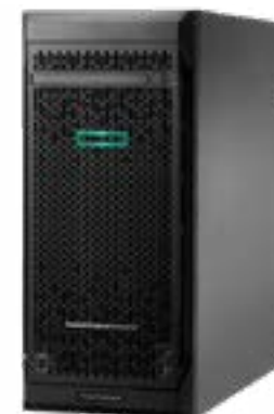
ProLiant ML110 Gen10