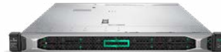
ProLiant DL360 Gen10