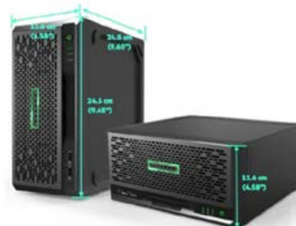
ProLiant Microserver Gen10 Plus