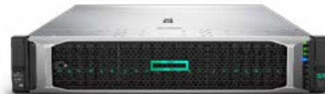
ProLiant DL380 Gen10