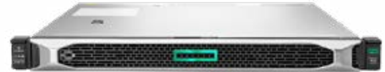
HPE ProLiant DL160 Gen10