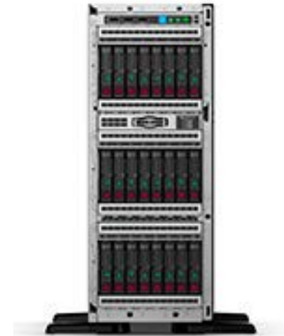
ProLiant ML350 Gen10