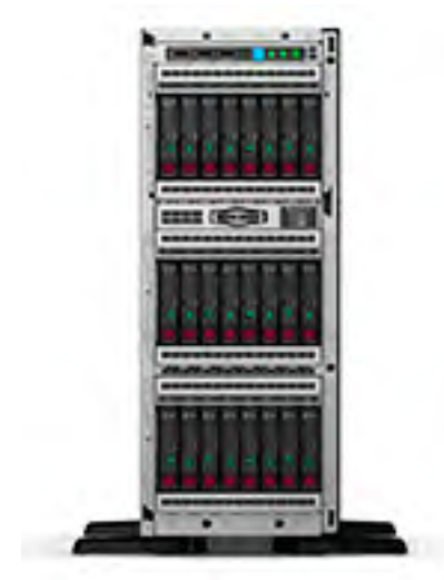
Proliant ML350 Gen10