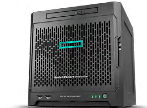
ProLiant Microserver Gen10