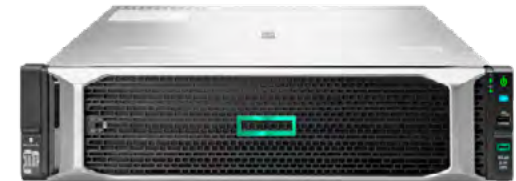
ProLiant DL180 Gen10