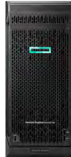
ProLiant ML110 Gen10