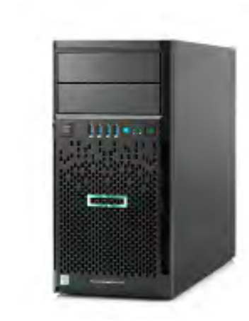
ProLiant ML30 Gen9