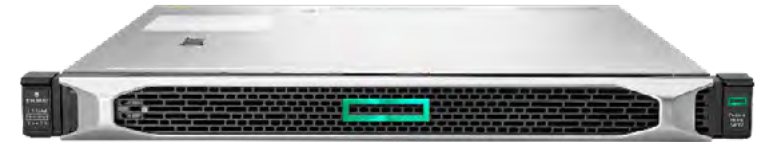
HPE ProLiant DL160 Gen10