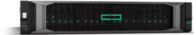
ProLiant DL385 Gen10