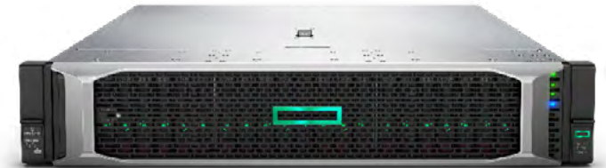
ProLiant DL380 Gen10