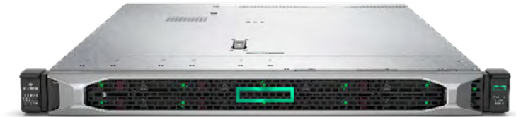
ProLiant DL360 Gen10