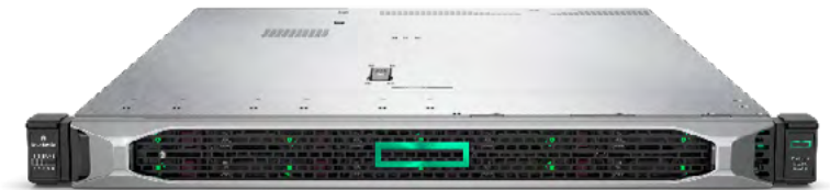
ProLiant DL325 Gen10