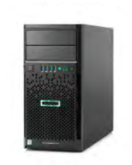
ProLiant ML30 Gen10