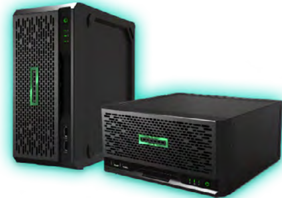
ProLiant Microserver Gen10 Plus