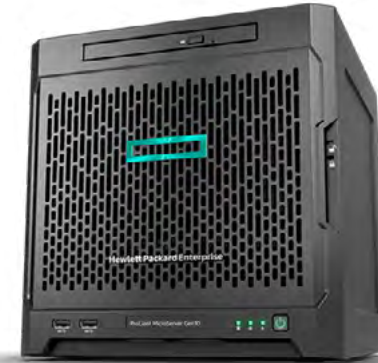
ProLiant Microserver Gen10